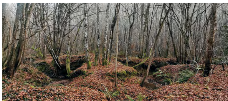
Bois communal de la Salvetat

Nous vous invitons à nous rejoindre le samedi 24 mai à 10 heures, sur la place de La Salvetat. L'un des thèmes abordés sera