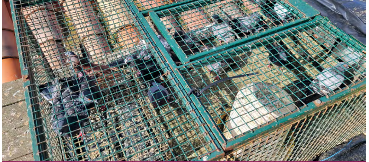
Cage installée sur le toit de l'église par la SACPA pour piéger les pigeons

Pour donner suite aux retours des agriculteurs concernant la destruction massive de leurs semis au printemps 2024, ainsi qu'aux plaintes de nombreux administrés quant aux déjections importantes en centre-bourg, la municipalité a lancé une nouvelle campagne de piégeage pour réguler le nombre de pigeons, en partenariat avec la SACPA (Société d'Assistance pour le Contrôle des Populations Animales). Les pigeons résidents du pigeonnier (bagués) seront relâchés pour maintenir le principe de régulation.