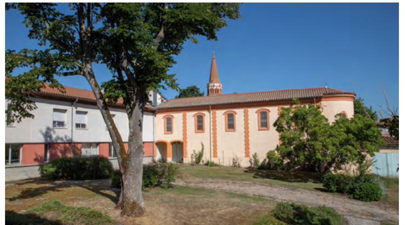
Vue de l'EHPAD et du couvent de nos jours