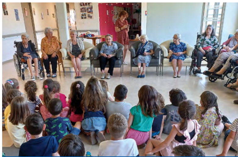
Echanges entre les enfants et les résidents de l'EHPAD