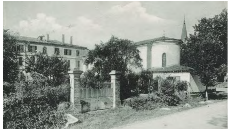
Le couvent dans les années 30