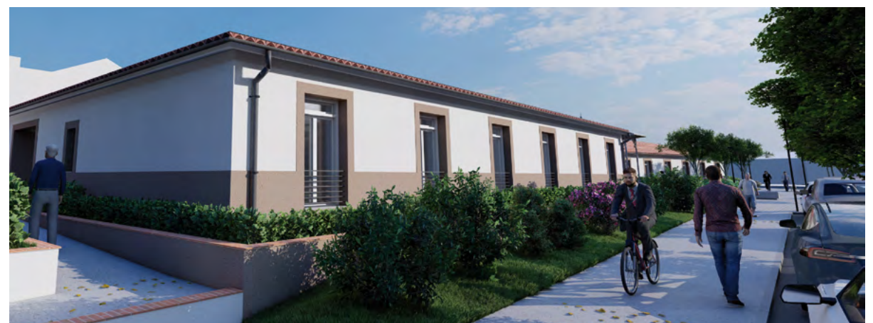
Construction de maisons partagées pour les séniors

« L'Albergue » est également engagé sur le plan écologique, avec une transition énergétique réussie. L'établissement, entièrement électrique, a entrepris un gros travail dans le cadre de la sobriété énergétique. Il a procédé à un relamping (remplacement de l'éclairage par des ampoules à LED), à l'isolation des points singuliers et des combles,