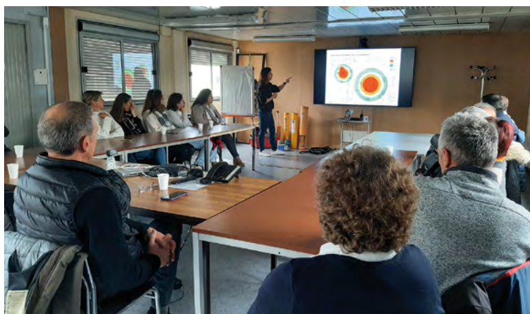
Agents et élus en visite sur le site Ruggieri le 14 novembre 2024

Tous les 3 ans, un exercice PPI (Plan Particulier d'Intervention) est organisé avec la mairie, l'entreprise et la Préfecture pour tester la réaction de tous les acteurs