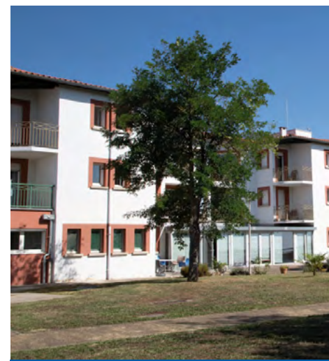
Jardin sud de l'EHPAD

de cuisine centrale, permettant de produire les repas pour les écoles de la commune.