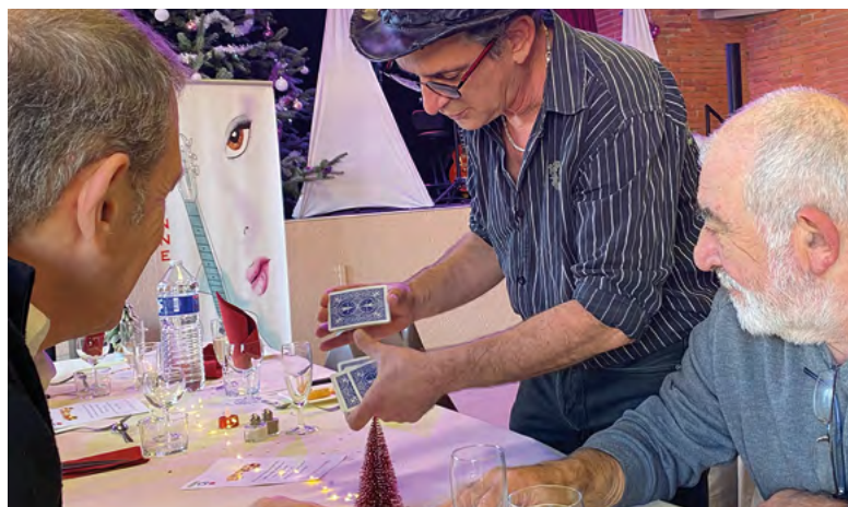
Au repas de Noël, petits plats, musique et magie !

Par ailleurs, 8 familles ont reçu une aide pour l'inscription de leurs enfants à des associations culturelles ou sportives, et 8 autres ont été aidées à participer aux sorties organisées par l'association "Les T'asmalou ?". S'il n'y a pas eu de sorties scolaires en 2024, le CCAS maintient ses aides pour l'année 2025 (les formulaires de demande peuvent être téléchargés sur le site internet de la commune).