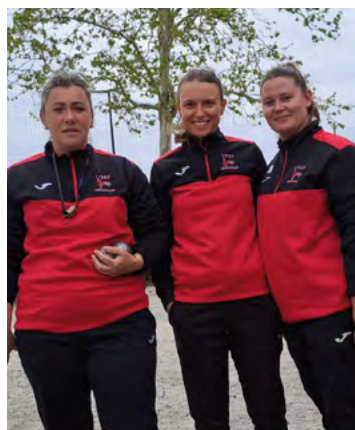
Les « Totally Spice »

Aux beaux jours, de mai à septembre, venez donc vous mesurer à nos drôles de dames lors des vendredi soir en 4 parties, qui, étant donné leur succès, seront reconduits en 2025.