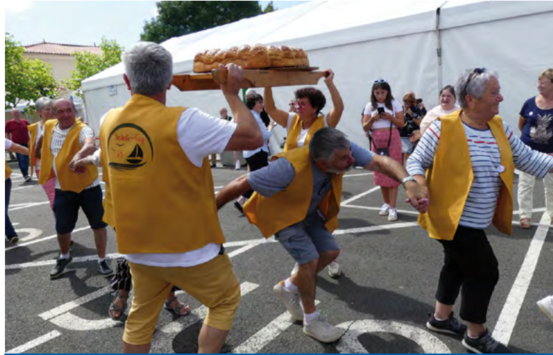
La danse de la brioche vendéenne

Site de l'association des Fidésades en Savès : http://fidesiadesensaves.jimdo.com/