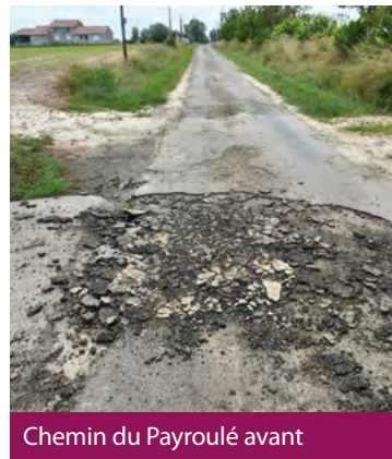
Chemin du Payroulé avant