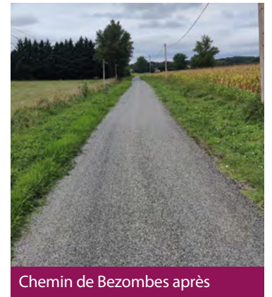
Chemin de Bezombes après