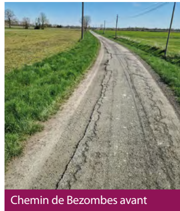
Chemin de Bezombes avant

Dans le cadre des appels d'offres gérés par la communauté de communes, l'entreprise DUPUY a été sélectionnée pour mener à bien ces travaux. Nous vous remercions de votre patience face aux perturbations occasionnées durant cette période.