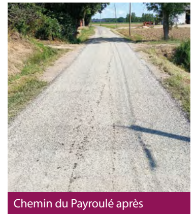
Chemin du Payroulé après