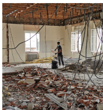
Travaux de la MSP