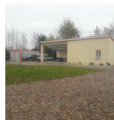
Salle de la Galage