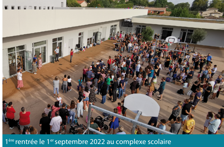
1 ère rentrée le 1 er septembre 2022 au complexe scolaire