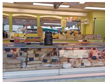
L'étal de la fromagère

des burgers, des snackings, des desserts, le tout préparé avec des produits français et locaux. Tous les mercredis dès 17h30, place Henri Dunant devant la Poste. Vous pouvez passer commande à Jessica Santon au 07 72 06 03 72 ou juste vous présenter.