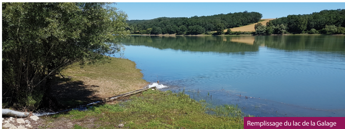
Remplissage du lac de la Galage

des températures, la reprise de la végétation limitent fortement l'alimentation des réserves d'eau.