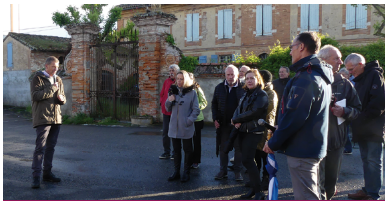
Arrêt près du château d'eau pour discuter du marché de plein vent et du futur lotissement

Les professionnels de santé, de leur côté, travaillent d'arrache-pied depuis plusieurs mois aux formalités administratives de la mise en forme de leur maison de santé. Après avoir communiqué en amont leurs souhaits d'aménagement de ce local auprès de l'architecte, ils se penchent maintenant sur le choix des différents matériaux. Il était indispensable que cette maison de santé