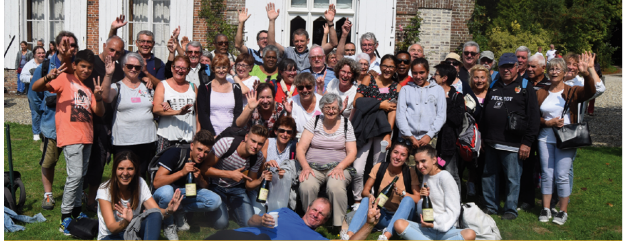
En 2018, l'équipe des Fidésiades et les Foyens se déplacent à Sainte-Foy en Normandie

Les Sainte-Foy de France est une association loi 1901, créée en août 1998, à l'initiative de quelques maires. Cette association organise depuis 1999, le rassemblement des «Sainte-Foy de France», au mois d'août par l'une des 17 communes de France portant le patronyme «Sainte-Foy». Les communes (par un ou des élus) sont membre de cette association, ou pour certaines communes, par le biais d'une association. L'assemblée générale se tient dans la commune qui organise "les Fidésiades". En 2012, c'est au tour de Sainte-Foy-de-Peyrolières d'organiser ce rassemblement. L'association « Fidésiades en Savès » est alors créée pour organiser cette manifestation. Depuis déjà 10 ans, l'équipe des Fidésiades en Savès organise de nombreuses activités pour financer un bus et une partie de l'hébergement permettant ainsi