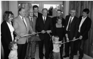
32 - Le chaudron magique, étape inauguration