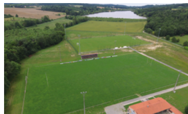
49 - Second terrain de grand jeu