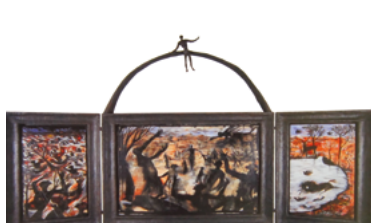
13 - Daniel Coulet