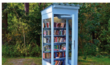
6 - Cabine à lire