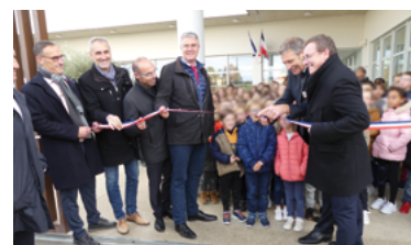
27 - Inauguration complexe scolaire