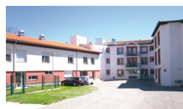
28 - Inauguration d'une renaissance