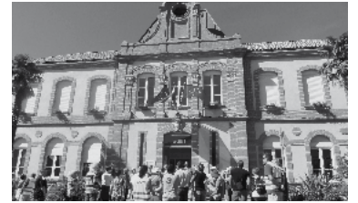
55 - Journées du patrimoine