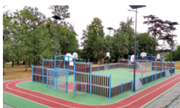
11 - City stade