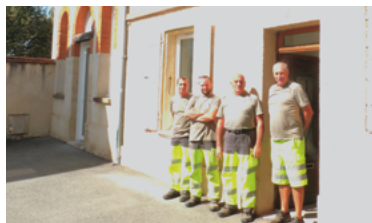
41 - Patrimoine immobilier de la commune