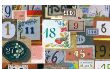
40 - Numéros d'habitation