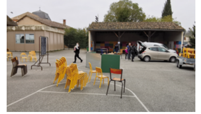
54 - Travaux de démolition de l'ancienne école