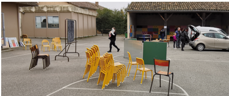
Vente du mobilier scolaire le 4 mars 2023

Depuis le transfert de l'école élémentaire vers de nouveaux locaux en septembre 2022, les 4 structures préfabriquées situées sur l'emprise foncière du terrain de l'ancien groupe scolaire ne sont plus utilisées, de même que le préau et le bâtiment baptisé « salle de motricité » ainsi que la « ludothèque » qui a été transférée juste un peu plus loin, dans l'ancienne salle informatique de l'école.