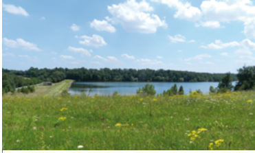
30 - Inventaire de la biodiversité