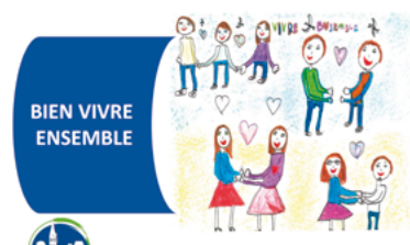
3 - Bien vivre ensemble