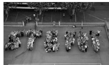
23 - Fidésiaades en Savès