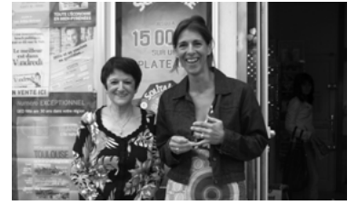
53 - La relève est assurée