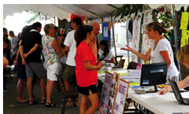
5 - Forum des associations