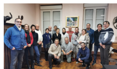
25 - Un grand merci aux associations