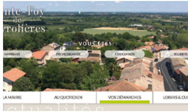
39 - Nouveau site internet