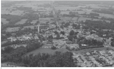
29 - Zone d'activités