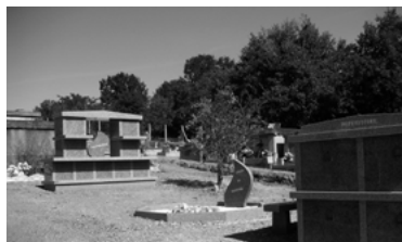
10 - Cimetière, travaux réalisés, en cours et à venir