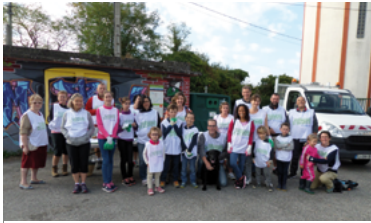
31 - La force du collectif