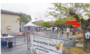
36 - COVID-19