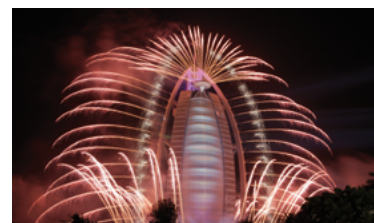
22 - Le feu d'artifice s'exporte