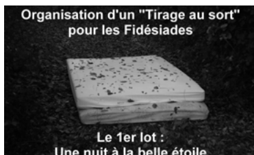
12 - Civisme Bienvenue chez nous