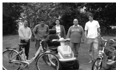
19 - Evol Electric