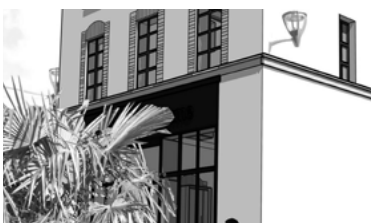
35 - Maison du Tailleur Office du tourisme