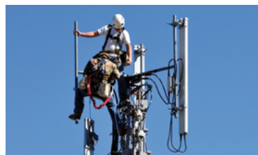
16 - Déploiement de la 4G