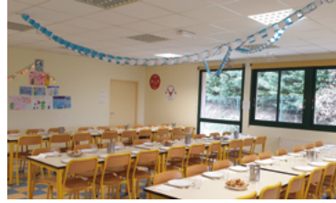
46 - Repas à 1€