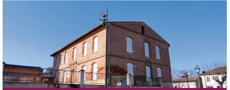
L'ancienne école élémentaire avant sa transformation en MSP

Les travaux sont découpés en 9 lots (gros œuvre, menuiseries intérieures, menuiseries extérieures, plâtreries, revêtements sols, électricité, plomberie, chauffage, ascenseur, peinture). Les appels d'offre ont été lancés le 15 décembre 2022. La Commission d'Appel d'Offre (CAO) s'est réunie le 3 mars 2023 pour présenter son rapport d'analyse des offres et sa proposition de classement. Le 7 mars dernier, le conseil municipal a validé la liste