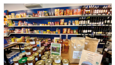
60 - Tabac presse