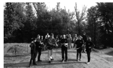
26 - Inauguration du terrain de bosses