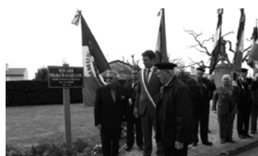
52 - Square Michel Bataillou