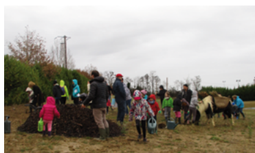
8 - Chantier participatif