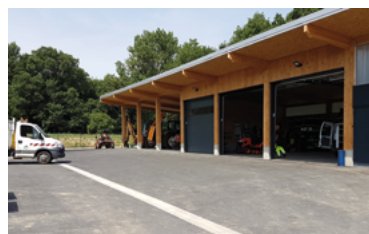
50 - Agents techniques