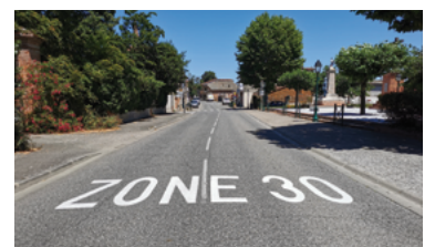
59 - Zone 30