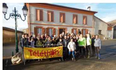
51 - Soutien au téléthon