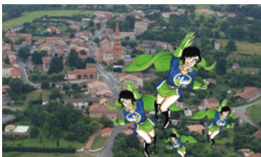
33 - Les superwomen de Sainte-Foy