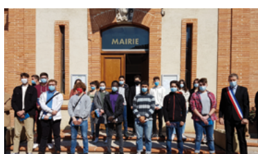
7 - Cérémonie citoyenne