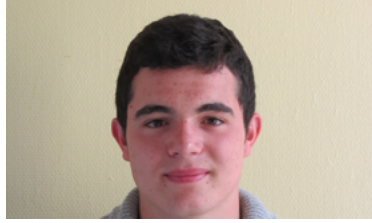
38 - Médaillé au concours MAF