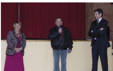
34 - Maire honoraire