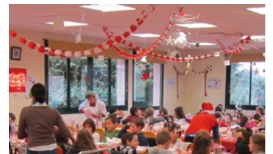
57 - Un beau projet... cuisine partagée