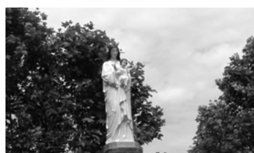
18 - En couleur, Notre Dame du lait