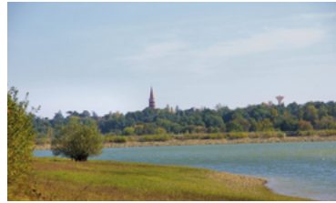
47 - Sainte-Foy rejoint le canton de Cazères