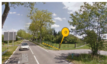
9 - Chemin piétonnier et piste cyclable