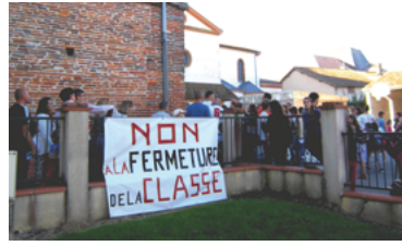
45 - Rentrée des classes, tout est bien qui finit bien