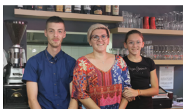
4 - Bienvenue aux nouveaux commerçants