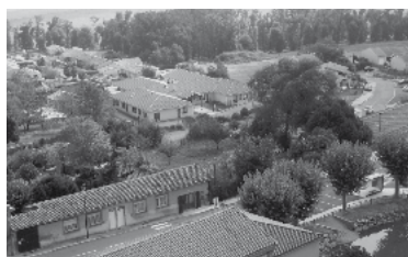
42 - Projet de crèche