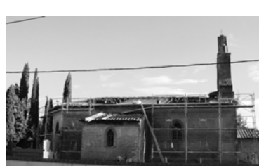
48 - Sauvegarder la chapelle