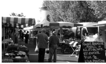
37 - Marché Les Halles de Sainte-Foy