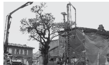
24 - Future boulangerie