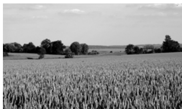
2 - Agriculture