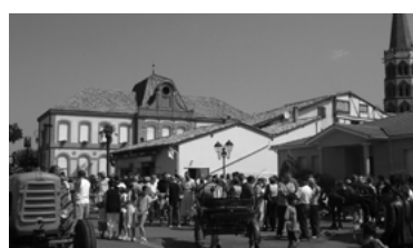
21 - Fête du cheval