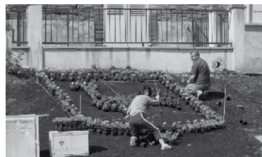
17 - L'école a son blason en fleurs