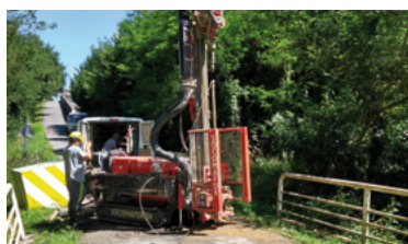
43 - Pont d'en Caillaouet