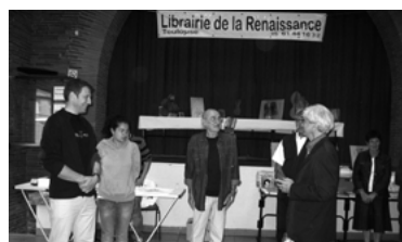
20 - Festival du Livre