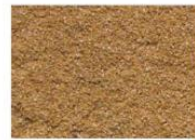
brique moulée paille