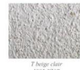
T beige clair 1005-Y20R