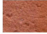
brique moulée rose