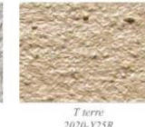
T terre 2020-Y25R