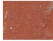
tuile ocre rouge