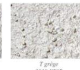
T grège 3010-Y20R