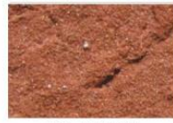
brique moulée rouge