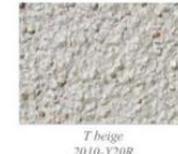
T beige 2010-Y20R