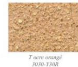
T ocre orangé 3030-Y30R