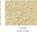
T paille 2030-Y10R