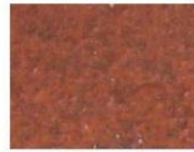
tuile rouge vieillie