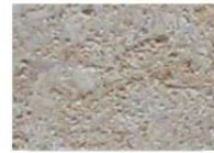
grès de Furne