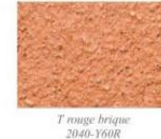
T rouge brique 2040-Y60R