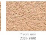
T ocre rose 2520-Y40R