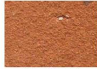
brique moulée orangée