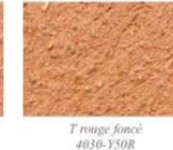
T rouge foncé 4030-Y50R

Ces teintes peuvent s'appliquer sur les façades d'immeubles à peindre. Les références proviennent du Natural Color System (N.C.S.).