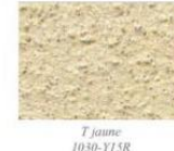
T jaune 1030-Y15R