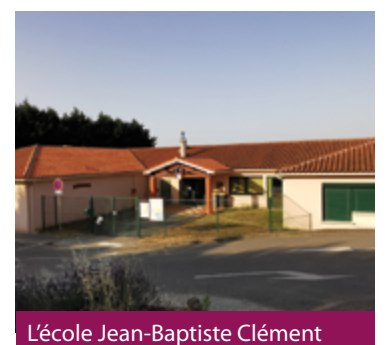
L'école Jean-Baptiste Clément