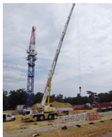
Septembre 2021 : premières grues