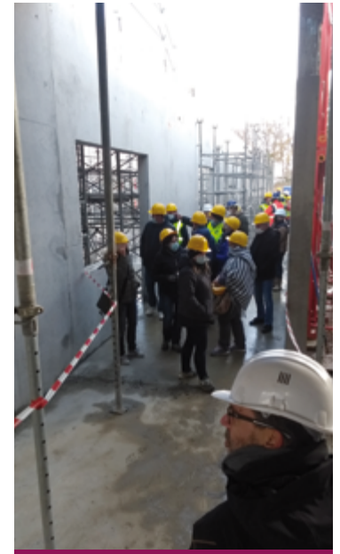
Décembre 2021 : visite de chantier

La livraison du bâtiment a été faite en août 2022. Les vacances scolaires ont été mises à profit pour peaufiner, déménager le matériel existant et équiper les