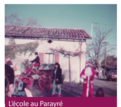
L'école au Parayré