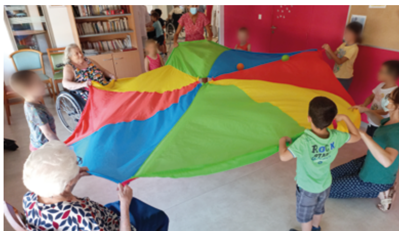
Le jeu du parachute

Afin de favoriser l'accès à la pratique sportive ou culturelle de vos enfants, le CCAS propose un dispositif d'aide financière pour l'adhésion à une association. Le formulaire de demande est à télécharger sur le site internet de la commune.