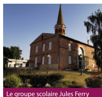
Le groupe scolaire Jules Ferry