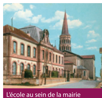
L'école au sein de la mairie

La salle des fêtes du Parayré a été construite à l'emplacement de l'école fermée en 1987, un ensemble qui alignait un préau, une salle de classe et un appartement de fonction.