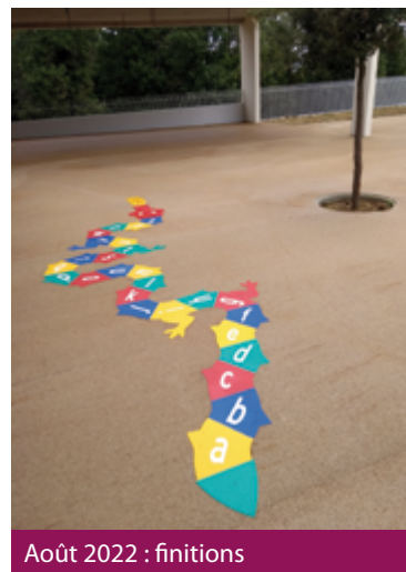
Août 2022 : finitions