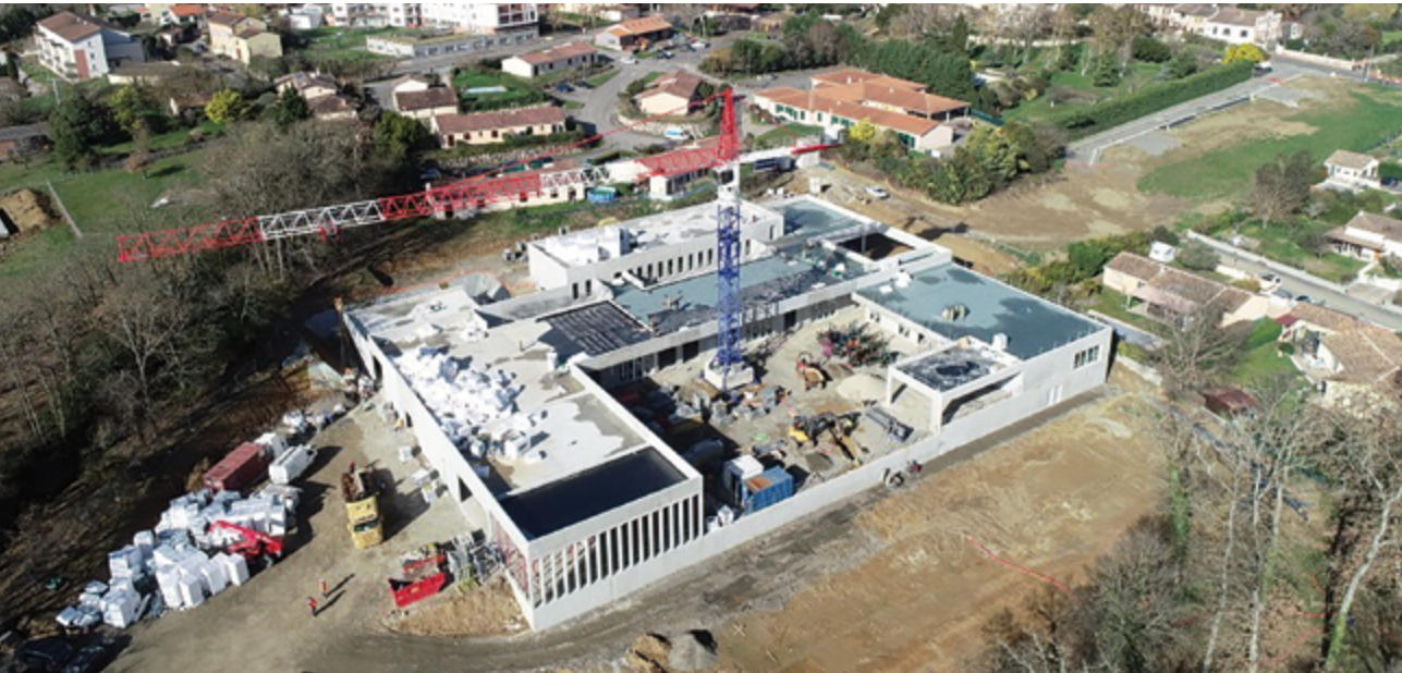
Février 2022 : la structure générale du complexe prend forme