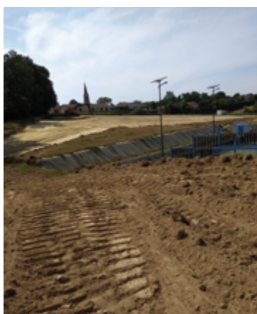
Juillet 2021 : terrassement

Retour en images sur le déroulement des différentes étapes du chantier sans oublier la nouvelle voirie réalisée par la Communauté de communes Cœur de Garonne.