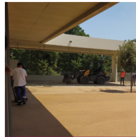
Juillet 2022 : l'enrobé est en cour de réalisation