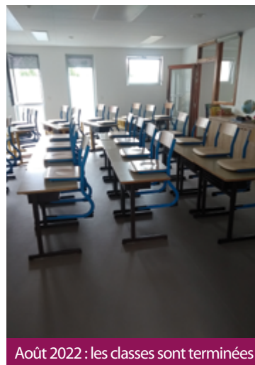
Août 2022 : les classes sont terminées