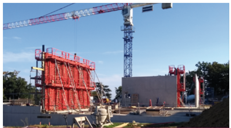
Octobre 2021 : les premiers coffrages