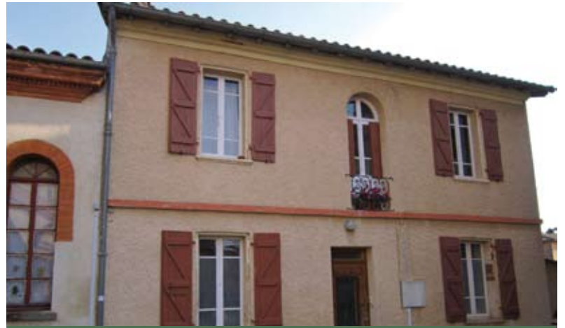
Achat de la maison entre l'église et la mairie

Pour permettre aux élus de se rendre aux différentes réunions, locales ou extérieures, sans contrainte, nous avons décidé dès 2008 de répartir les indemnités sur l'ensemble des élus. L'utilisation partielle de l'enveloppe des indemnités nous a permis d'économiser plus de 90 000€ sur l'ensemble du mandat.