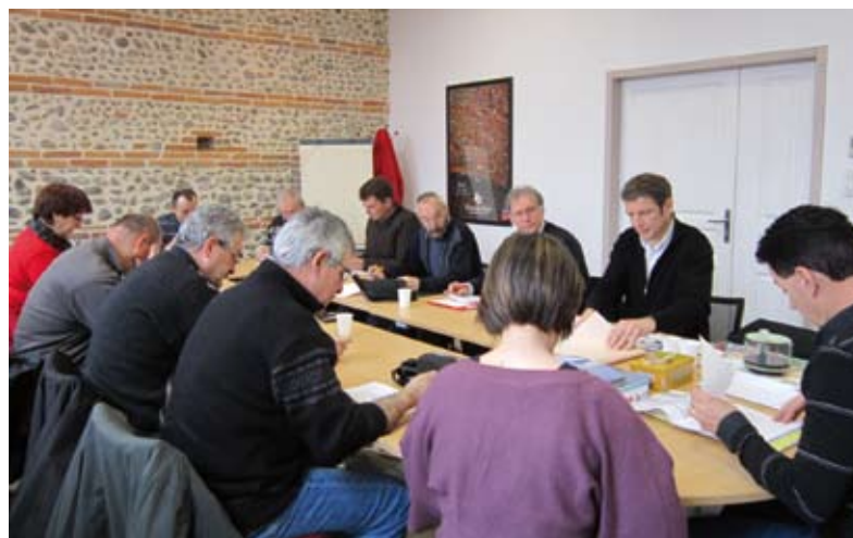
Réunion de la commission communale des impôts avec le géomètre du cadastre en avril 2013

Le CCAS est composé de 10 personnes : le maire agissant en tant que président, cinq membres élus en son sein par le conseil municipal et cinq membres (habitants) nommés par le maire. Le CCAS tient au moins une séance par trimestre et met en place des actions ciblées. En toute confidentialité, il est à l'écoute et au service de toute personne ayant besoin d'une aide dans le domaine social.