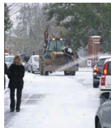
Depuis l'hiver 2012 (-10 à -15°), les services municipaux savent comment agir face au déclenchement du Plan Grand Froid.

Le Document d'Information Communal sur les Risques Majeurs a été distribué à chaque foyer en mai 2012 (un des premiers du Département - avec félicitations du Sous-Préfet pour sa qualité) ; un balisage délimite désormais le périmètre SEVESO des Etablissements Lacroix ; de nombreux exercices d'entraînement, impliquant la Préfecture, la gendarmerie et les pompiers, ont été réalisés sur la commune ; des bornes incendie ont été ajoutées ; un numéro d'astreinte a été mis en place pour joindre un élu les soirs et week-end.