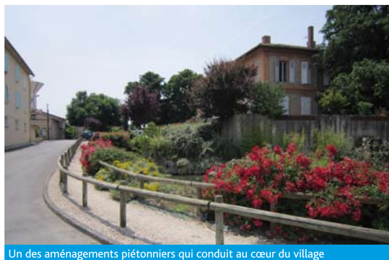
Un des aménagements piétonniers qui conduit au cœur du village

Au cimetière de Sainte-Foy, les allées du cimetière ont été réhabilitées, les sépultures abandonnées reprises, un caveau rénové sert d'ossuaire et un site cinéraire a été créé.