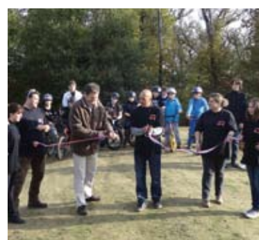
Inauguration du terrain de bosses