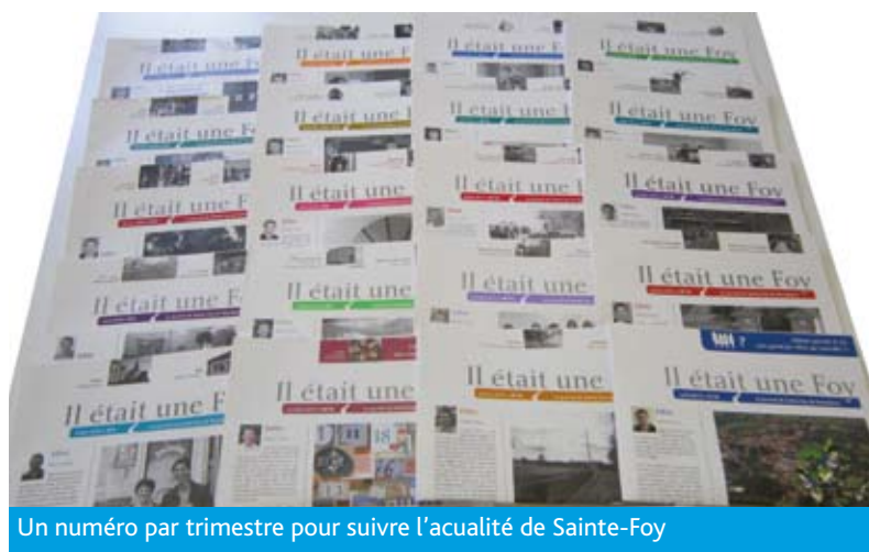
Un numéro par trimestre pour suivre l'actualité de Sainte-Foy