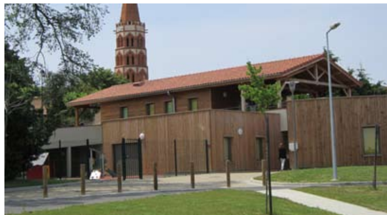
La crèche : un accueil de proximité pour nos tout-petits

La persévérance de l'équipe municipale a permis l'ouverture de la crèche « le Chaudron magique » et de la Maison de la Petite enfance dans le même bâtiment. La Communauté de Communes du Savès a mené le projet en coopération avec la municipalité. La construction, réalisée en 9 mois, a ouvert ses portes le 5 septembre 2011.