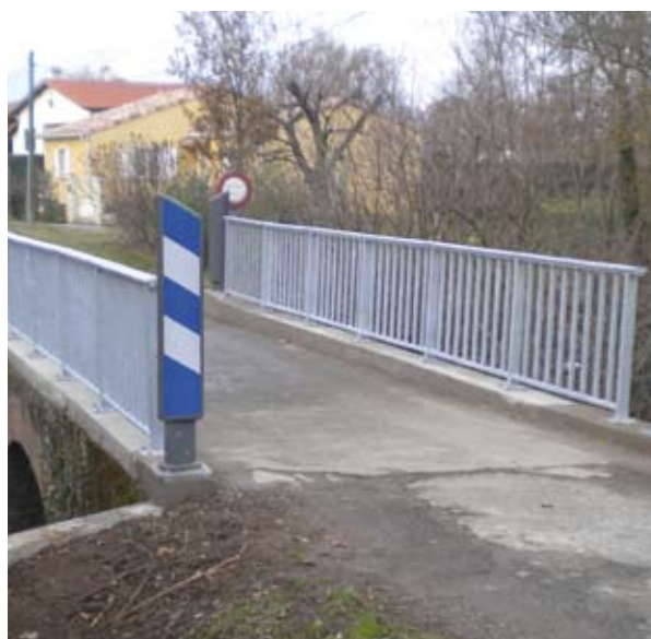
Le pont des Berdotes avant et après