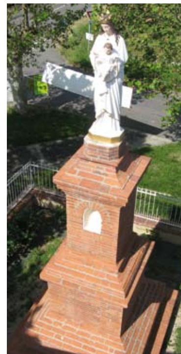
La statue de Notre Dame du Lait a repris ses couleurs d'origine en juin l'année dernière

Nous avons souhaité vous associer à la réalisation des projets communaux et intercommunaux, ainsi vous pouvez en temps réel retrouver les sujets d'actualités sur les sites de la commune www.sainte-foy-de-peyrolieres.fr , de la Communauté de Communes du Savès www.ccsaves31.fr et de l'Office de Tourisme Savès31 www.tourisme-saves31.fr .