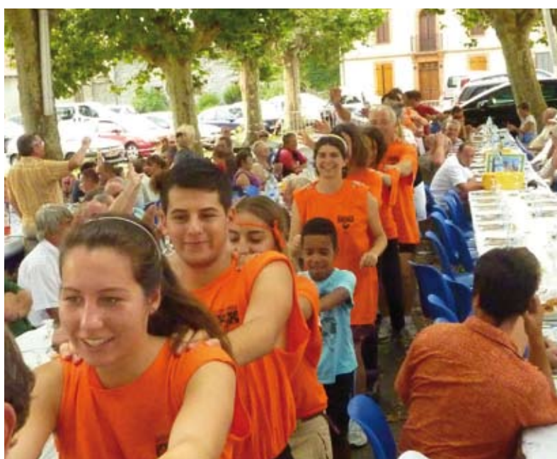
Coopération de la municipalité et de l'association Fidésiades en Savès pour l'accueil des Sainte-Foy de France

Cette communication est renforcée par la mise en place de nouveaux panneaux d'affichage et de banderoles pour les actions municipales et associatives (au rond-point, dans les hameaux et au centre du village).