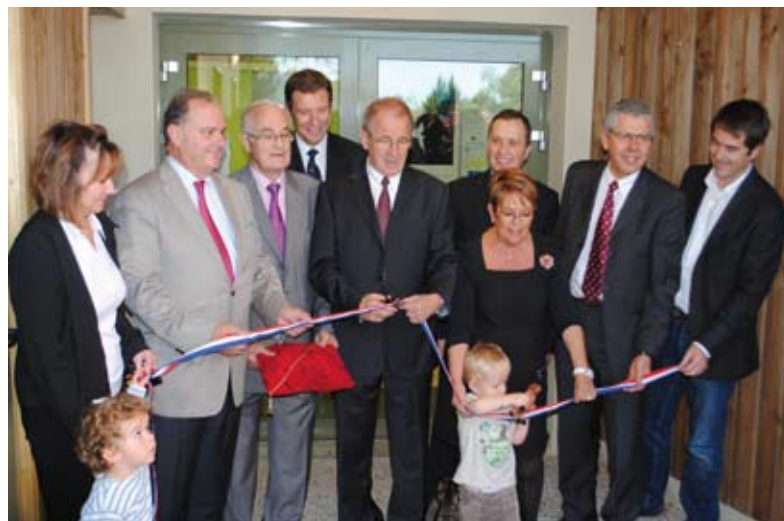
Inauguration de la crèche «Le chaudron magique» de Sainte-Foy le 14 octobre 2011

Depuis le 1 er janvier 2012, la commune a transféré à la CCS la gestion des chemins ruraux et des voiries communales. La CCS assure l'entretien courant des voiries et de ses annexes, les travaux d'aménagement et de réfection.