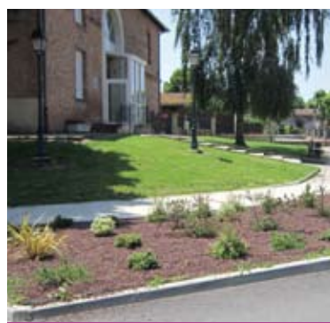
La toile verte sur les parterres limite le désherbant.