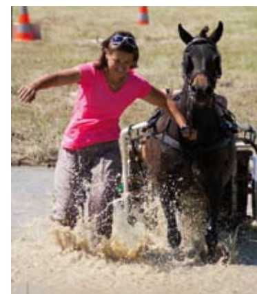
Fête du cheval 2013

→ Création du forum des associations ouvert au public