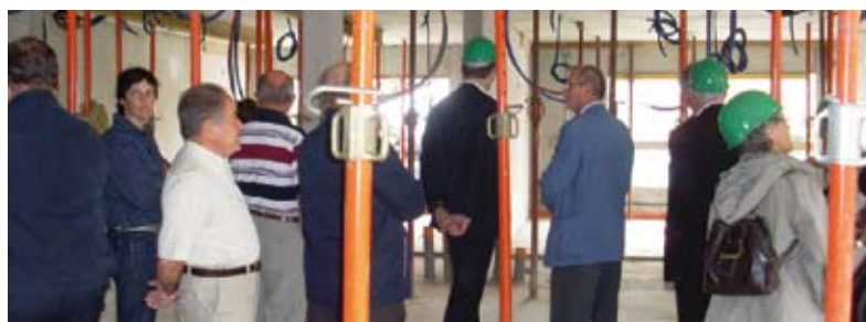
Visite de chantier fin 2011. L'extension de l'EHPAD : Plus de lits c'est aussi plus d'emplois sur la commune

légué à la sécurité traite le sujet avec la préfecture. Le service urbanisme accompagne les projets et veille à leurs aboutissements. L'aménagement du centre du village a été étudié pour faciliter l'accès aux commerces à pied ou en voiture, les travaux sont réalisés par lot de 60 et 80KE pour ne pas grever l'enveloppe du Pool routier. L'implantation de l'antenne relais Orange (dossier suivi de l'été 2009 à septembre 2012) et l'amélioration de la couverture par l'antenne SFR de Peguilhan permettent de satisfaire les utilisateurs de téléphonie mobile, les particuliers comme les professionnels.