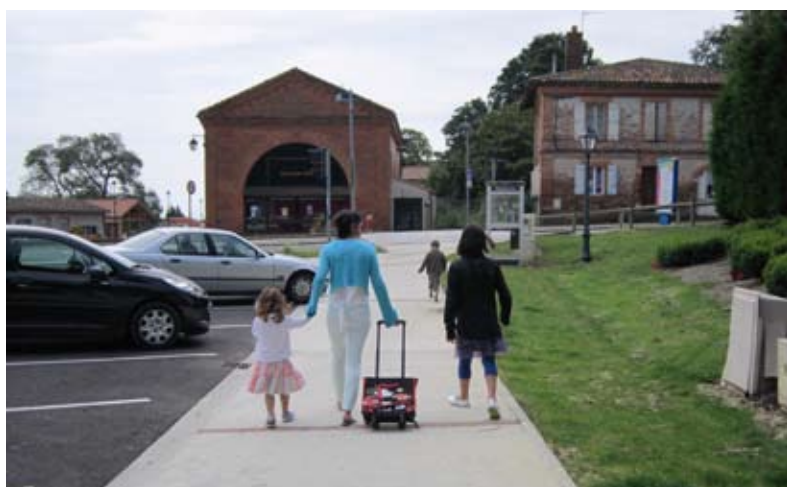
Sortie de l'école en toute sécurité pour les piétons

➔ Assurer la sécurité des personnes et des biens est un impératif qui nécessite une vigilance permanente des élus en charge et des travaux en continu depuis 2008. Différents domaines sont concernés : sécurité routière, risques majeurs naturels et technologiques, sécurité des bâtiments et des ouvrages.