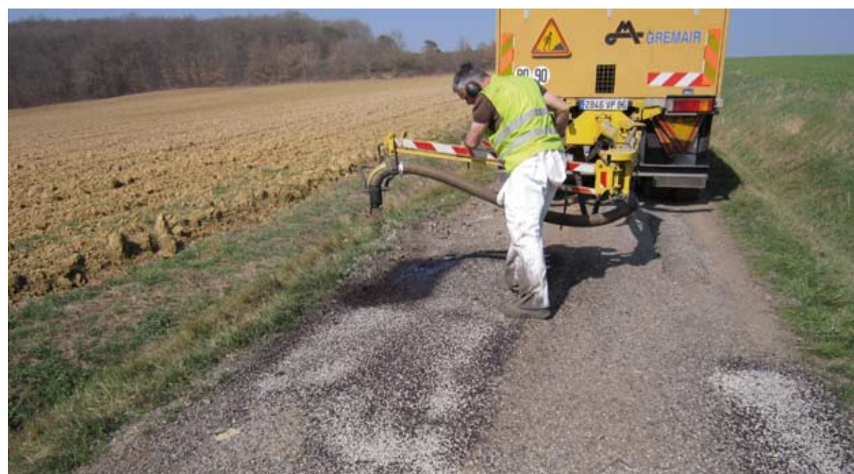
Nouveau procédé des travaux de réfection de voirie