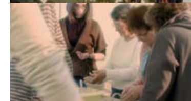
Un film didactique des services proposés par la CCSavès est disponible sur le site www.ccssaves31.fr