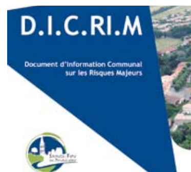
Les bons réflexes en cas de risques majeurs - Le DICRIM a été distribué à tous les foyers de Sainte-Foy