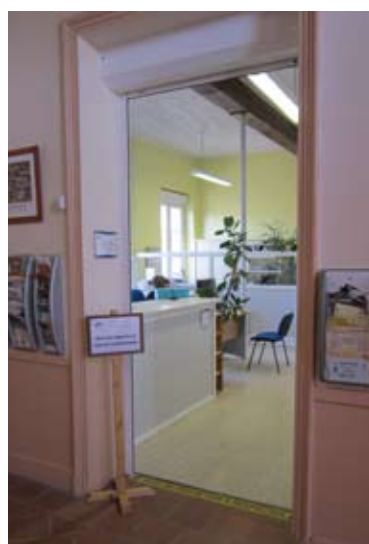
L'accueil de la mairie est au rez-de-chaussée (octobre 2008)

Un ordinateur a été installé dans le hall de la mairie, pour permettre aux Foyens qui en ont besoin de faire leurs démarches administratives par Internet.