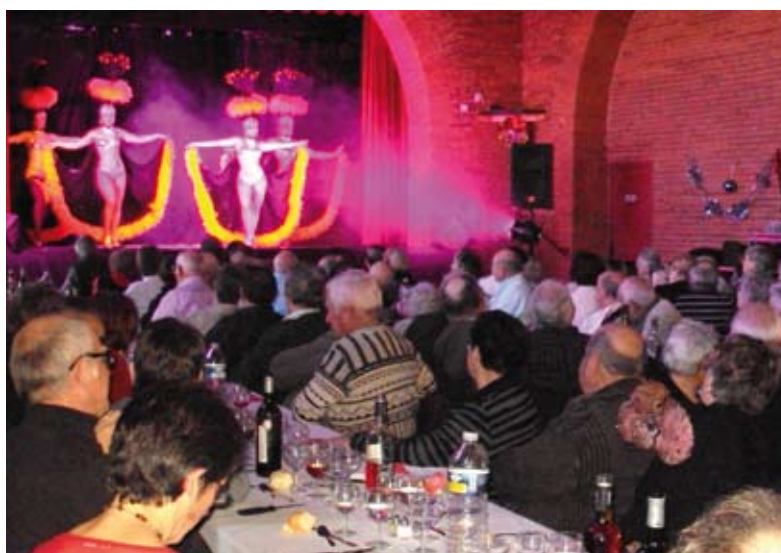
Le repas-spectacle du CCAS pour les anciens fait salle comble