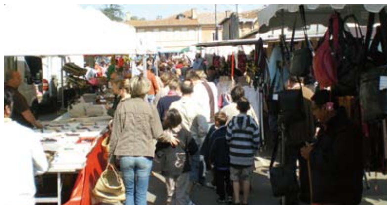
Le marché de plein vent le dimanche matin depuis le 17 avril 2011