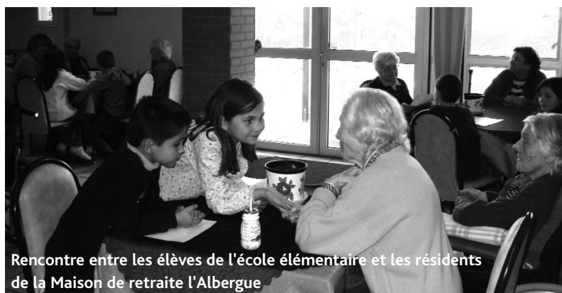
Rencontre entre les élèves de l'école élémentaire et les résidents de la Maison de retraite l'Albergue