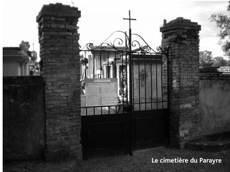
Le cimetière du Parayre