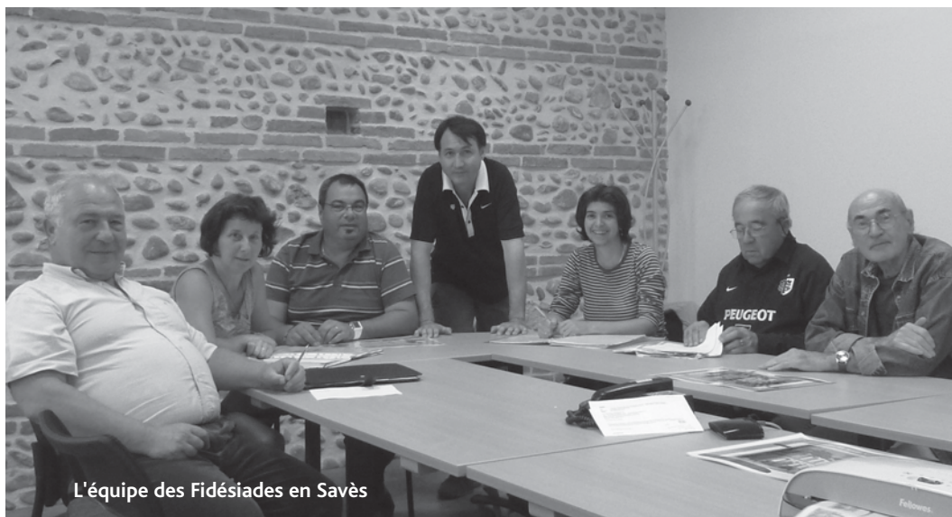
L'équipe des Fidésidiades en Savès