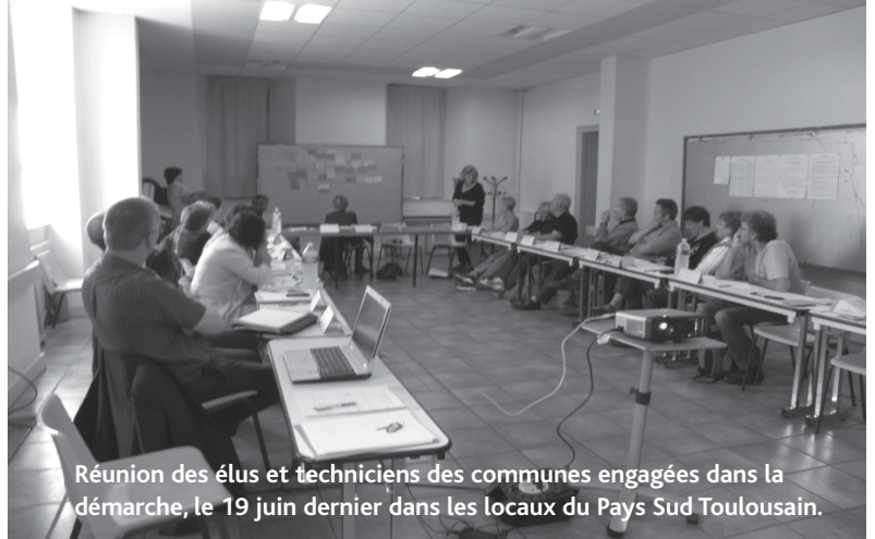
Réunion des élus et techniciens des communes engagées dans la démarche, le 19 juin dernier dans les locaux du Pays Sud Toulousain.

La raison du refus réside dans la proximité d'autres distributeurs sur Saint-Lys, « ce projet n'est pas éligible...car il ne répond pas aux critères...à savoir l'absence de distributeur dans un périmètre de 5 kms ou 20 minutes de trajet automobile ». La municipalité a donc décidé de se tourner vers une solution plus commerciale La Banque Postale ou une autre banque. Nous allons donc « prospecter » à nouveau !