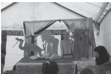
Noure et Nazim les personnages du Conte lors du Festival du Livre 2012

Contact APE par mail : ape.ste-foy@hotmail.fr - Site Internet : http://apestefoy.wifeo.com/