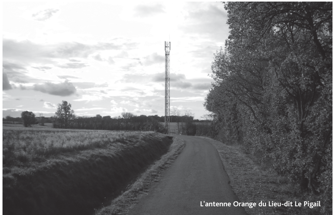
L'antenne Orange du Lieu-dit Le Pigail