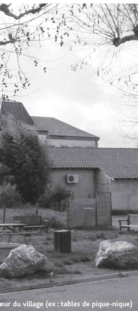
Leur du village (ex : tables de pique-nique)