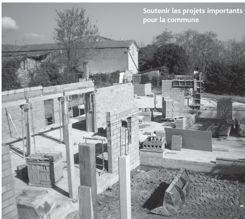
Soutenir les projets importants pour la commune

► Acquisition de Patrimoine : Achat du terrain « Cabrita » aux portes du village côté Rieumes en 2009 (59600€) et Achat de la maison Descamps au cœur du village entre église et mairie (200000€)