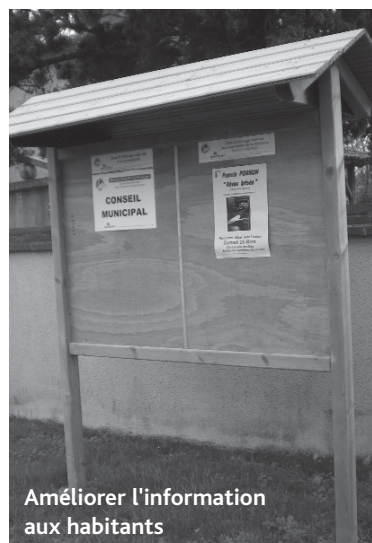
Améliorer l'information aux habitants

Notre présence sans faille au sein de la CCS a facilité l'aboutissement de nombreux projets : la construction de la crèche (2011 : 1,2 millions €), la distribution de containers jaunes (2010) pour les ordures ménagères, le transport à la demande vers le marché de Rieumes, le portage des repas, aide à l'équipement d'un chauffe-eau solaire, réhabilitation de la maison du Tailleur Rieumes.