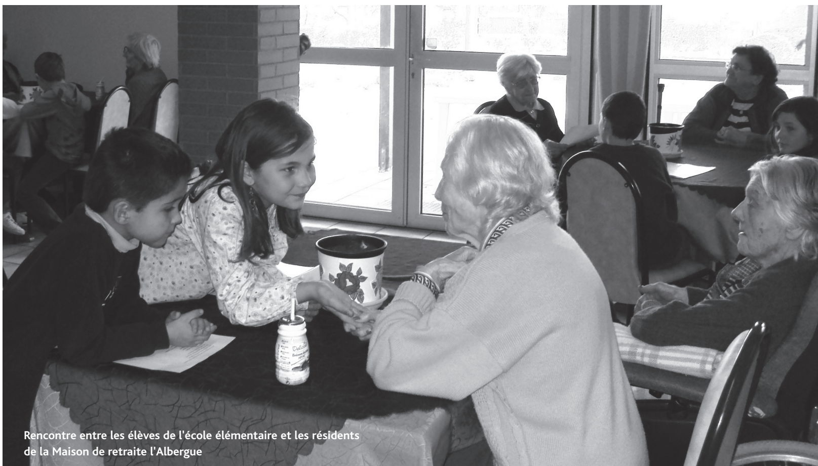
Rencontre entre les élèves de l'école élémentaire et les résidents de la Maison de retraite l'Albergue

Animer les actions de prévention et de développement social dans la commune, tel est le rôle du Centre Communal d'Action Sociale