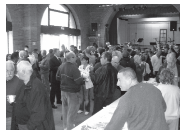
le rendez-vous du dimanche midi