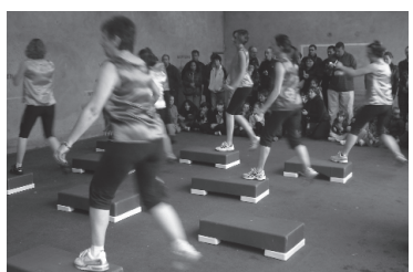
L'asso Ste Foy Sport/Loisirs en démonstration