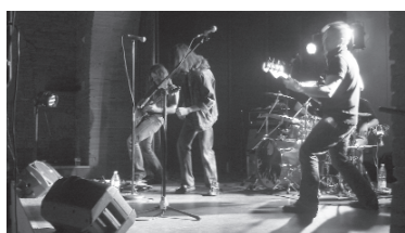
Malgré la pluie, le Comité des fêtes a assuré le vide grenier et le concert de Staffylorock.