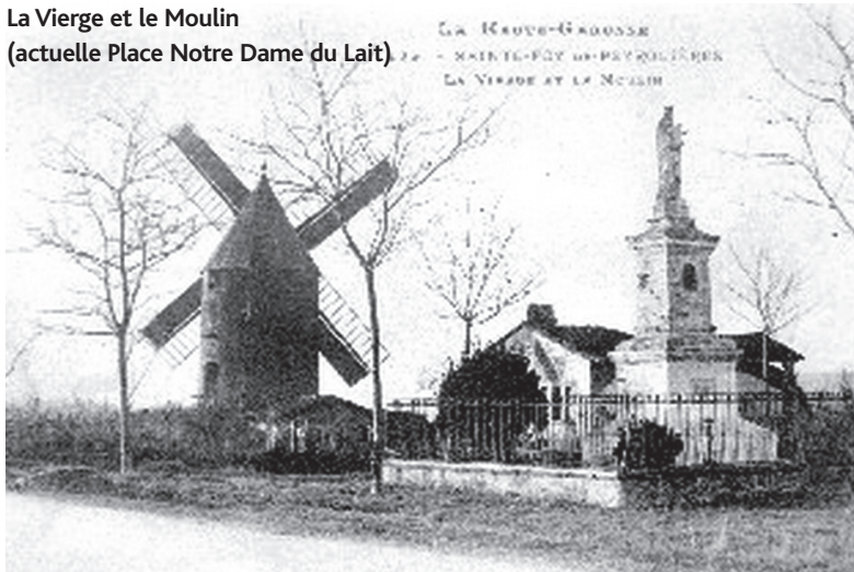
La Vierge et le Moulin (actuelle Place Notre Dame du Lait)

► Article de Michel Sicard Association pour la Sauvegarde des moulins du canton de St Lys Renseignements : mn.sicard@wanadoo.fr - 05 61 52 47 20