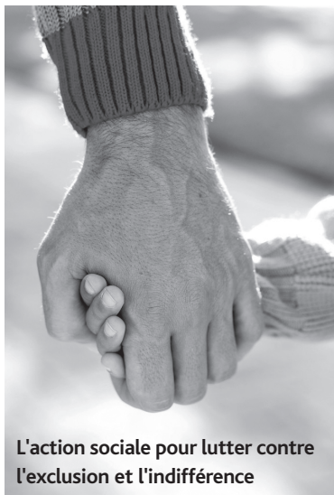
L'action sociale pour lutter contre l'exclusion et l'indifférence

Elle était de 2000€ en 2007, elle est aujourd'hui d'environ 6000€, ceci marque la volonté de la municipalité d'agir en faveur des personnes en difficultés en cette période de crise économique.