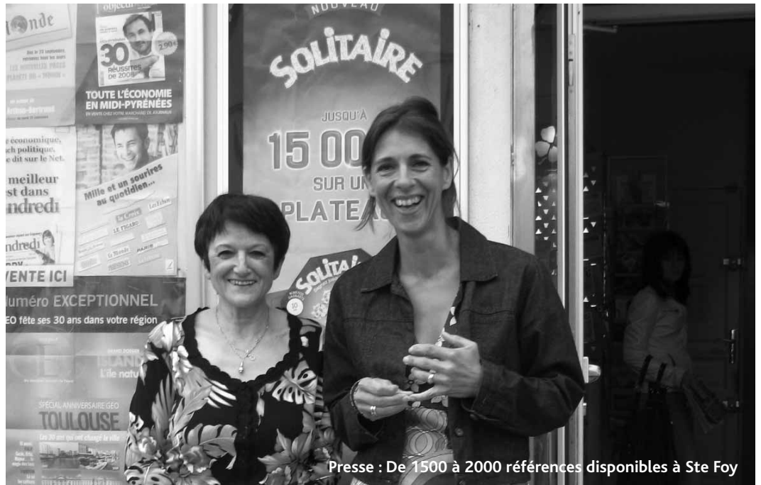
Presse : De 1500 à 2000 références disponibles à Ste Foy