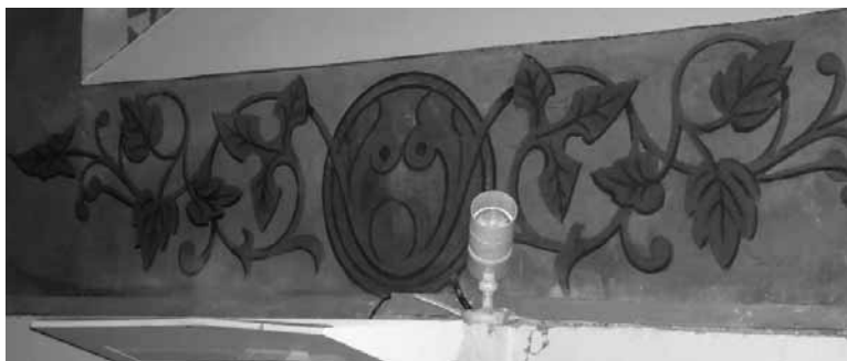
Une des fresques rénovées en mars