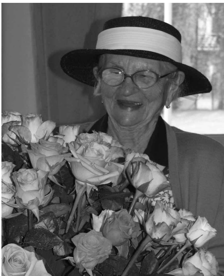
Un bouquet de 100 roses lui a été offert par les élus, pour fêter l'évènement.