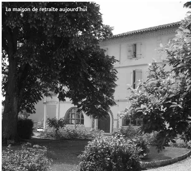
La maison de retraite aujourd'hui