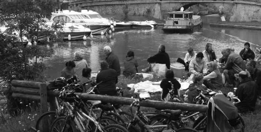
Randonnée Sent'Aure le long du Canal du Midi – week-end du 8 mai 2009