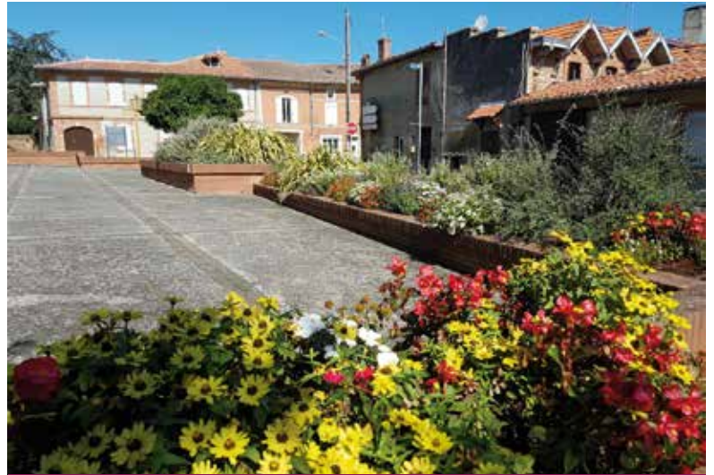
Le parvis de la salle des fêtes bien fleuri

Pour encourager les déplacements à vélo, deux nouveaux râteliers à vélos ont été installés : à l'école élémentaire et à la poste. D'autres lieux ont aussi été toilettés : les rocs le long de la maternelle et rue Saint-Jude, le rond-point, le Clos du Trujol et la haie au stade.