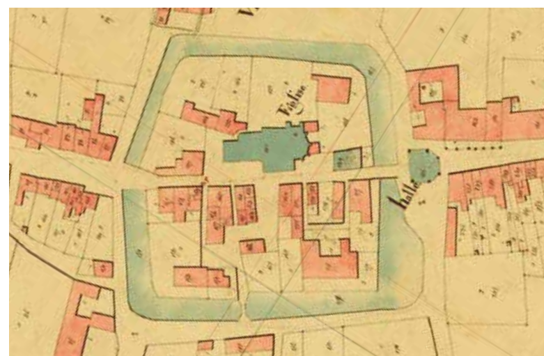
Le cadastre napoléonien