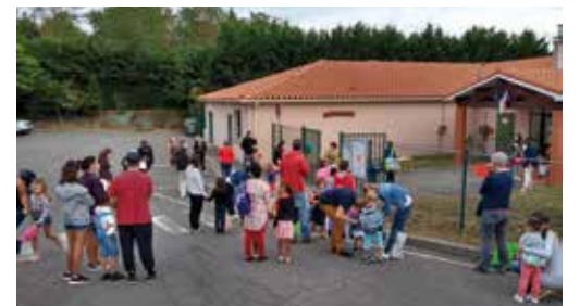
La rentrée à l'école maternelle

Pour les 150 élèves de l' école élémentaire , cette rentrée est particulière... c'est la dernière au 3 Allée des platanes : de nouveaux locaux les accueilleront en septembre prochain ! Les effectifs restent stables : 20 CP, 20 CP/CE1, 23 CE1, 27 CE2, 19 CM1, 19 CM1/CM2 et 22 CM2.