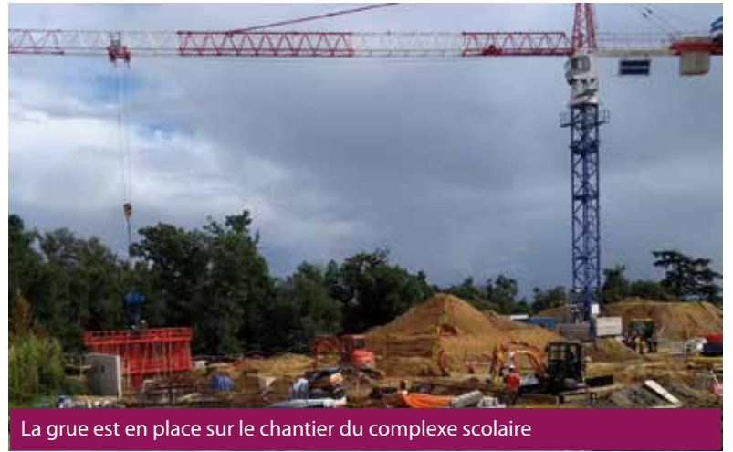
La grue est en place sur le chantier du complexe scolaire

*L'enveloppe du bâtiment est constituée des parties du bâtiment qui isolent un bâtiment de l'extérieur : toit, murs et éléments imperméabilisants au-dessous du niveau du sol.