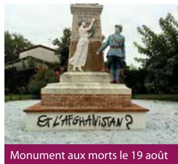
Monument aux morts le 19 août

Pour la plupart des Foyens, ce sont les dégradations de biens publics qui ont été perçues avec colère, une fois la surprise passée. Elles sont non seulement inesthétiques mais elles ont un coût non négligeable pour la collectivité. A titre d'exemple, le remplacement d'un panneau indicateur