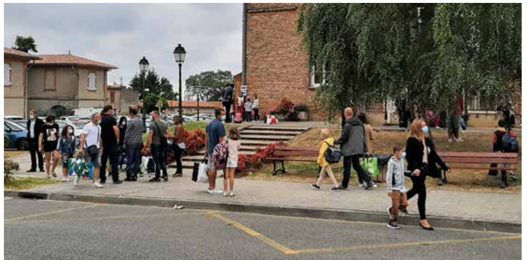
La dernière rentrée scolaire dans ces locaux pour les élèves de l'élémentaire

La rentrée s'est bien déroulée pour les 227 élèves scolarisés sur la commune.