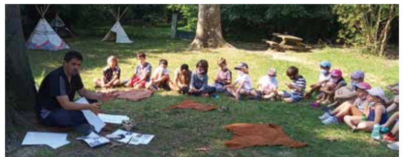
A la découverte de la préhistoire dans le parc de l'accueil de loisirs de Lherm

Petit retour sur le mois de juin... Pour clôturer l'année scolaire en beauté, les maternelles ont invité les élémentaires à partager une kermesse : jeux, danse et goûter festif étaient au rendez-vous.