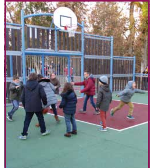
2017 : City stade