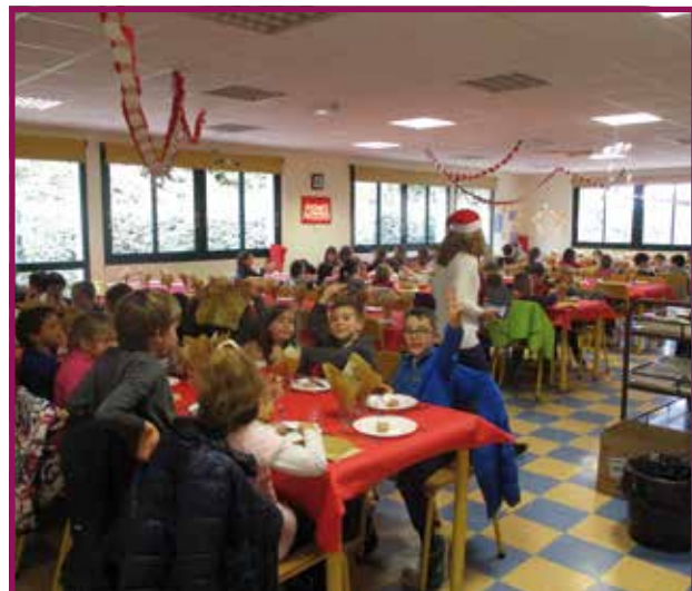
2018 : Cuisine partagée EHPAD/Restauration scolaire