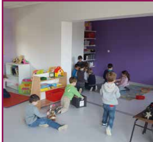
2016 : Agrandissement de l'école maternelle pour la création d'une salle ALAE