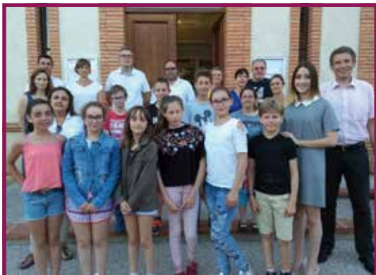
2018 : Création du Conseil municipal des jeunes