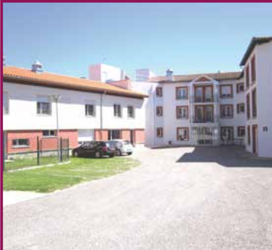
2014 : Renaissance de l'Albergue en tant qu'EHPAD (Emplois apportés par l'EHPAD = 50 équivalents temps plein)

Un mandat, ce sont des actions et des réalisations ! Quelques exemples qui ont changé l'apparence du village, ou le quotidien des administrés au cours des 6 dernières années.