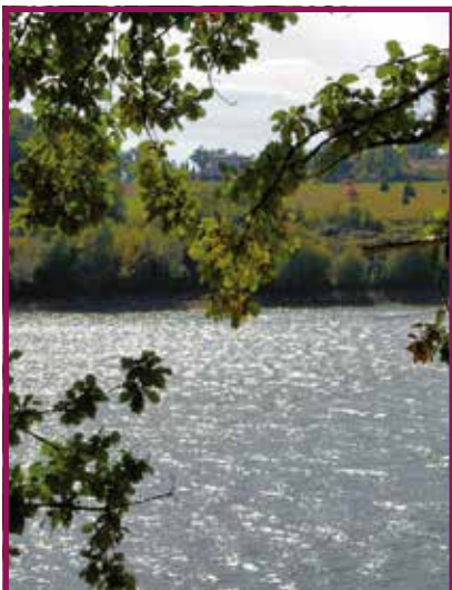
2018 : Atlas de la biodiversité communale