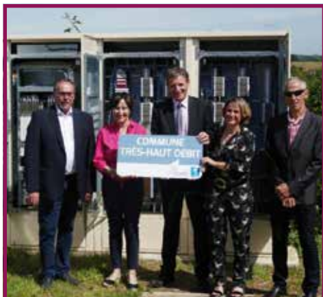
2018 : Montée en débit Internet