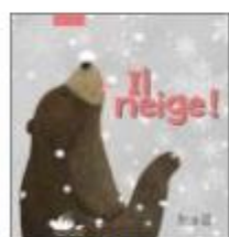
Il neige !