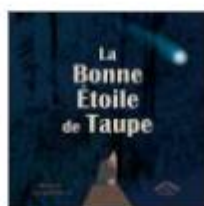
La bonne étoile de Taupe