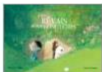
J'en rêvais depuis longtemps