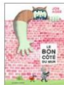
Le bon côté du mur