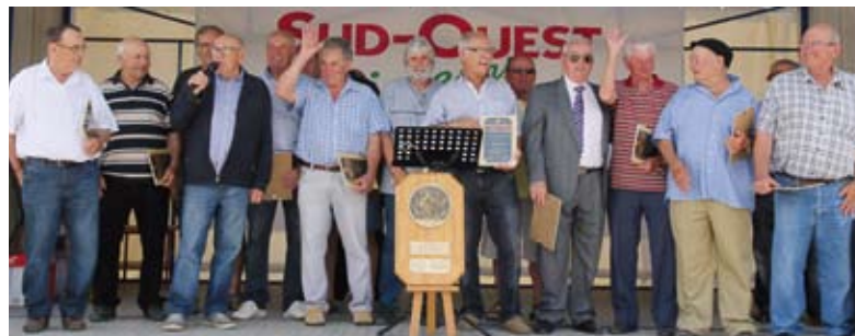
Les 1 ers joueurs de l'USSF Rugby (saison 1965) réunis pour fêter les 50 ans du club le 13 juin dernier. Plus de 500 personnes ont participé à cet anniversaire.