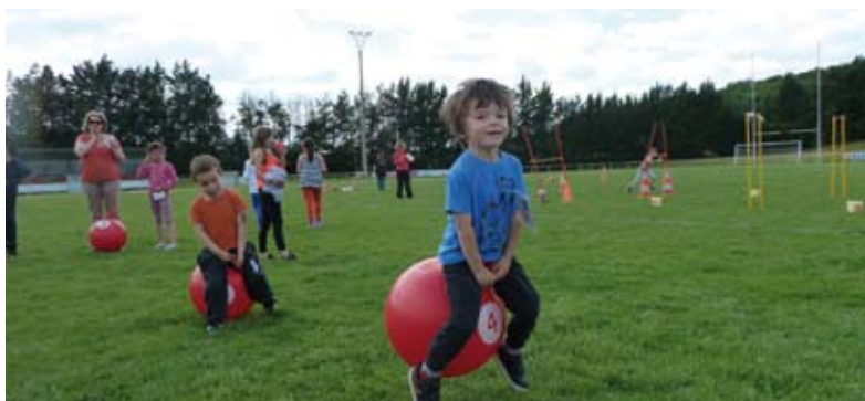
Joli succès pour les Olympiades des enfants le 30 mai

Pour la petite histoire, Sainte-Foy en Brionnais est la 1 ère commune organisatrice de l'évènement en 1999, et accueillait alors 50 participants. Le rassemblement a bien grandi depuis mais le concept reste toujours le même : découvrir une région et ses produits locaux, faire des rencontres amicales et se retrouver avec plaisir l'année suivante. Désolés pour les retardataires mais les inscriptions sont closes depuis le 20 juin.