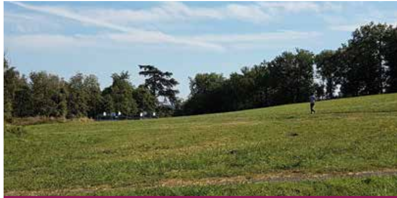
Le nouveau groupe scolaire se situerait sur le terrain entre le city stade et le lotissement Les Prés de la ville.

Cette réflexion commune avec OTEIS à laquelle ont été associés