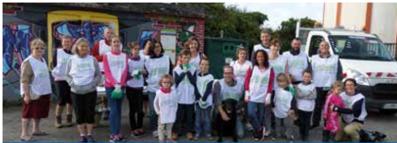
Challenge « Nettoyons la nature » du 30/09/2018, remporté par Sainte-Foy (520 kg de déchets ramassés).

En ces périodes de restriction budgétaire, il est important de trouver des solutions alternatives permettant de continuer à entretenir et embellir notre commune à moindre coût tout en passant un bon moment convivial.