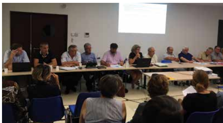
Rentrée studieuse des élus délégués à la Communauté de Communes Cœur de Garonne lors du Conseil communautaire du 18 septembre 2018.

Le 27 juin 2017, le conseil communautaire a autorisé la mise en enquête unique du dossier de