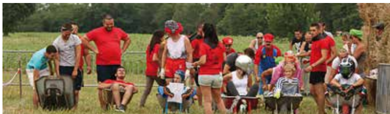
La Fête du cheval et des tracteurs