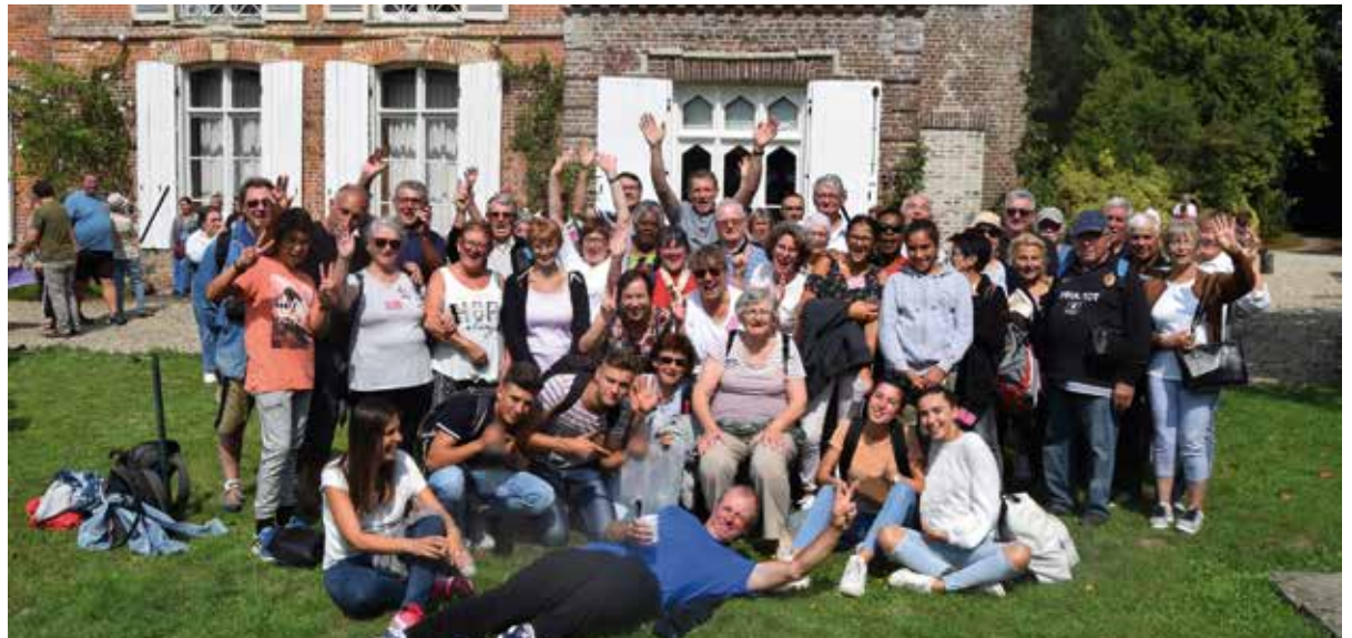
Les Foyens aux rassemblement des Fidésiades 2018 en Normandie

Le 17 août, grâce aux Fidésiades, une cinquantaine de Foyens sont partis à Sainte-Foy en Normandie pour le rassemblement des Sainte-Foy de France, un très long voyage mais un très beau séjour dont tous sont revenus enchantés et prêts pour l'an prochain à Sainte-Foy-la-Grande. Le Forum des Associations du 2 septembre a clôturé l'été, à la