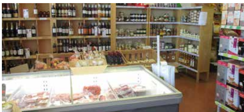
Le Magasin Point vert de la Coopérative Euralis – Route de Cambernard à Sainte-Foy