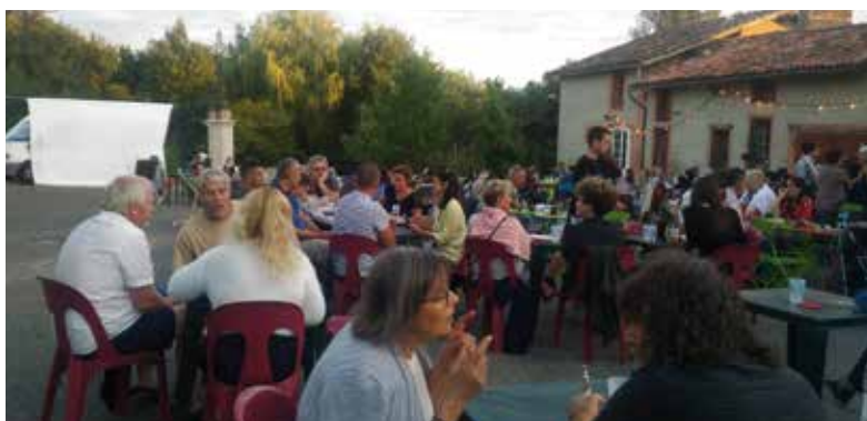
La Soirée Tapas – concert – ciné plein air du 14 août à la Chapelle Sainte-Anne