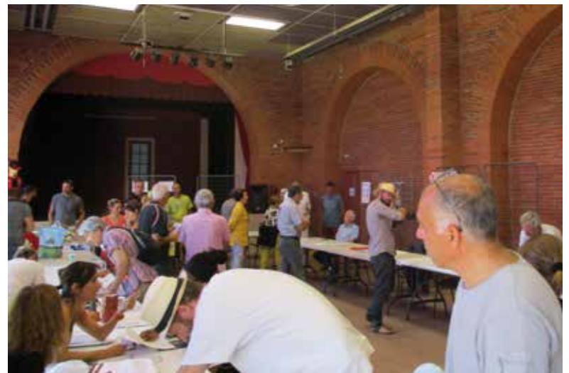
Le Forum des associations 2018

Merci à toutes et tous pour votre mobilisation et bonne année associative !