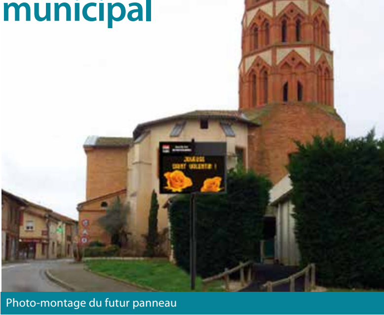
Photo-montage du futur panneau

L'équipe municipale a choisi de doter Sainte-Foy d'un panneau lumineux pour informer les Foyens au quotidien, à plus grande échelle et en limitant les inconvénients de l'affichage sauvage qui dénature le centre du village.