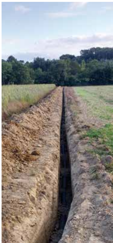
Enterrement de la ligne électrique moyenne tension, avant le démarrage des travaux