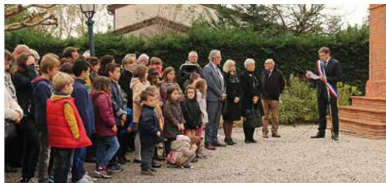
Participation importante des enfants de Sainte-Foy lors de la commémoration du 11 novembre en 2015

L'armistice de la première guerre mondiale sera commémoré à Sainte-Foy le samedi 12 novembre à 10h45. Les enfants de Sainte-Foy et leurs parents sont invités à y participer.