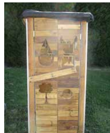
Où la trouver ? Allée des Platanes, face à la salle des fêtes

Pour en savoir plus : http://www.3pa.info