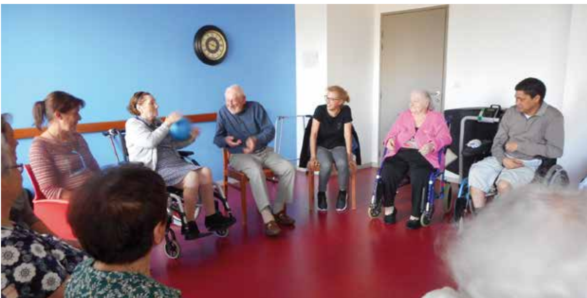
Animations assurées par des professionnels auprès des aidés, pendant les rencontres des aidants.

Depuis le mois d'avril, l'EHPAD « l'Albergue » propose des rencontres mensuelles aux habitants de la commune qui aident un proche en perte d'autonomie à cause de l'âge ou de la maladie. Ces rencontres, animées par une psychologue ont lieu un mardi par mois de 14h30 à 16h30 à l'EHPAD de Sainte-Foy. Ce sont