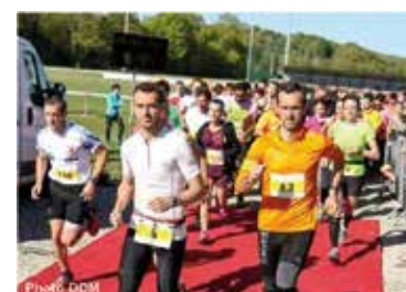
Bilan Course Nature La Foyenne : 45 coureurs sur le 5 km, 130 coureurs sur le 12 km, 120 marcheurs, 40 bénévoles et 3000€ reversés à l'association AMMI. L'AMMI remercie tous les sponsors qui ont participé à cet événement. Rendez-vous en avril 2018 pour la 2 ème édition de la course La Foyenne.