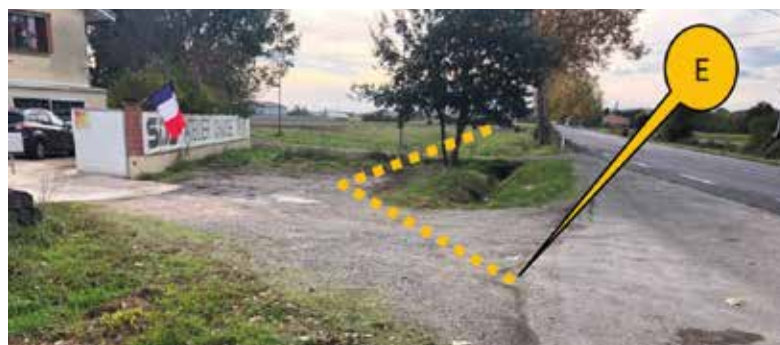
L'aménagement s'achèverait à l'extrémité Est (point E) au niveau de la contre-allée de desserte locale en limite de la commune de Saint-Lys.