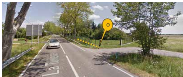
L'aménagement de la piste cyclable débuterait à l'extrémité Ouest (point O) depuis l'aire de co-voiturage.

Début 2018, le département s'est prononcé pour la prise en charge des aires de covoiturage : l'aménagement de celle de Sainte-Foy est prévu en 2019. Le service voirie départemental y travaille en accord avec le projet de piste cyclable.